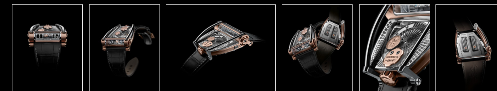
MOONMACHINE 2 RED GOLD FACE