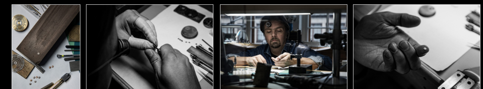
MOONMACHINE 2 SARPANEVA WORKSHOP 1