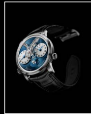
LMI XIA HANG WG FRONT