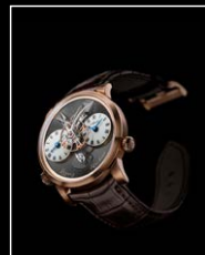
LMI XIA HANG RG FRONT