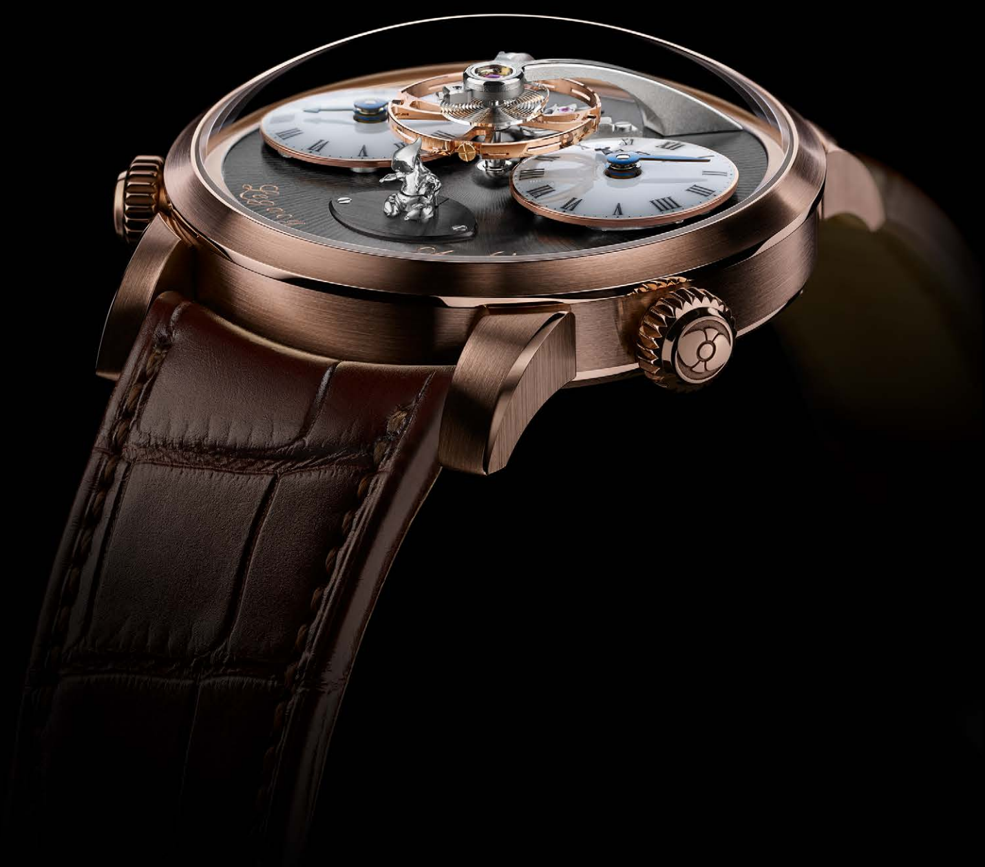
MB&F LMI XIA HANG - RED GOLD - LIMITED EDITION OF 12 PIECES