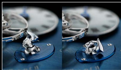
LMI XIA HANG WG POWER RESERVE MAN