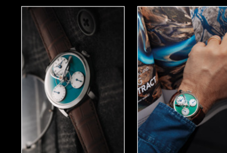
LM SE GREEN IN SITU 01 LM SE GREEN WRISTSHOT MAXIMILIAN BÜSSER PORTRAIT