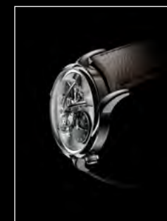
LM1 LONGHORN PROFILE