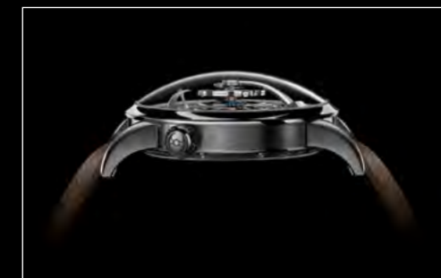
LM1 LONGHORN PROFILE 2