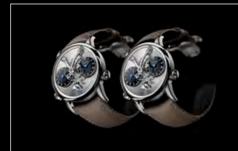
LM1 LONGHORN DUO