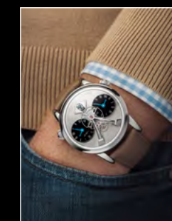
LM1 LONGHORN WRISTSHOT