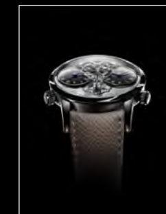
LM1 LONGHORN FACE