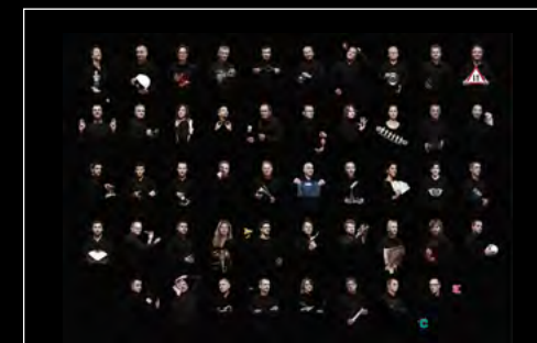
LM1 LONGHORN FRIENDS LANDSCAPE