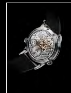
LM1 LONGHORN BACK