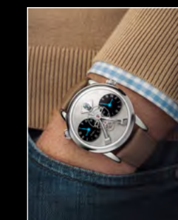
LM1 LONGHORN WRISTSHOT