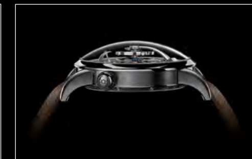
LM1 LONGHORN PROFILE 2