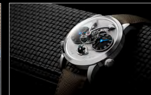
LM1 LONGHORN LIFESTYLE