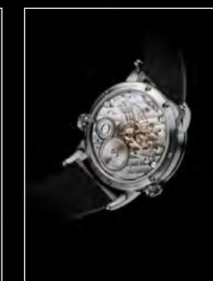
LM1 LONGHORN BACK