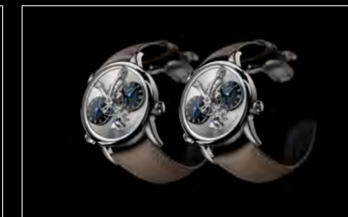
LM1 LONGHORN DUO