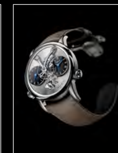
LM1 LONGHORN FRONT