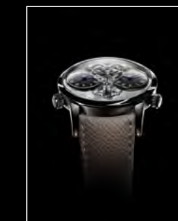
LM1 LONGHORN FACE