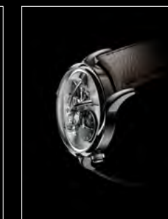
LM1 LONGHORN PROFILE