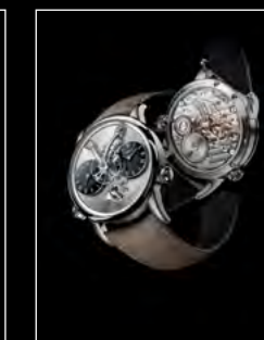
LM1 LONGHORN DUO