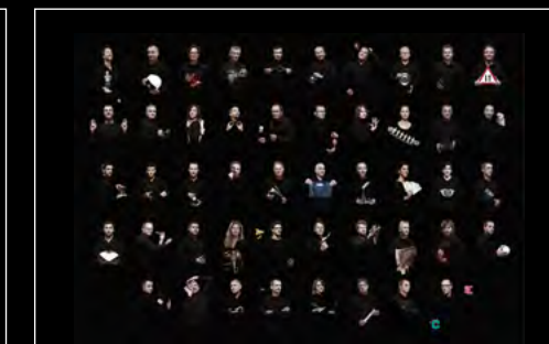
LM1 LONGHORN FRIENDS LANDSCAPE