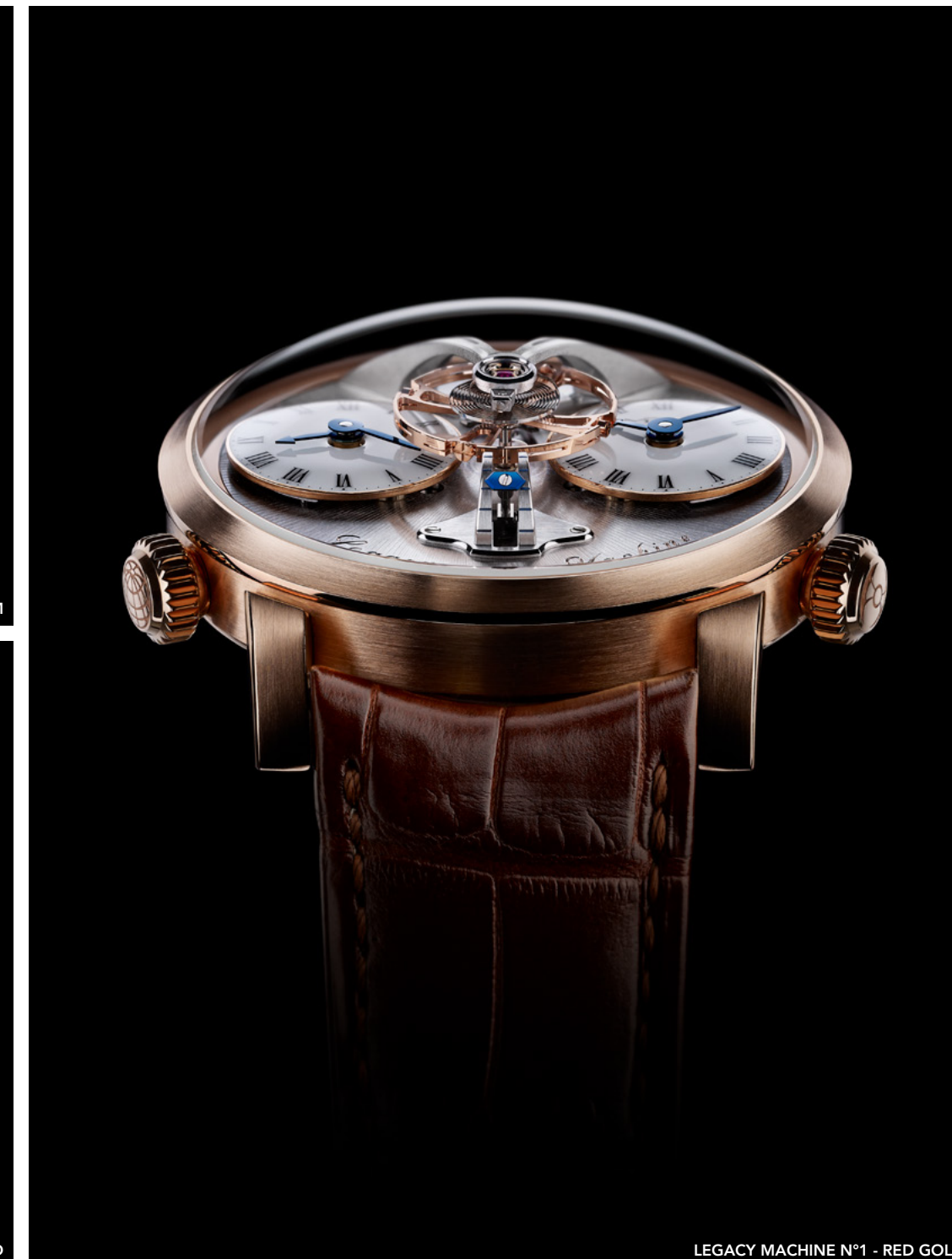
LEGACY MACHINE N°1 - RED GOLD