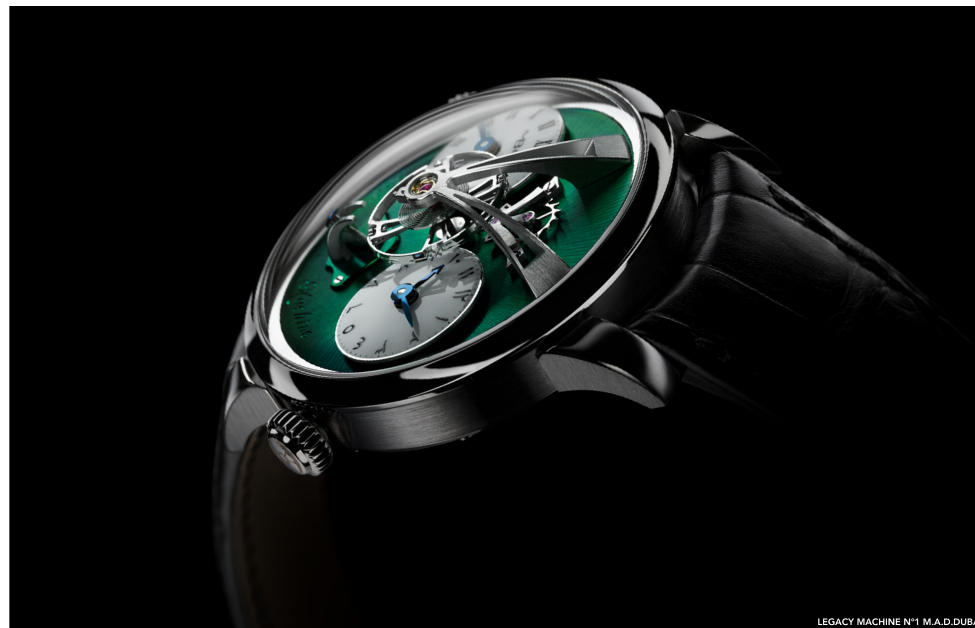
LEGACY MACHINE N°1 M.A.D.DUBAI