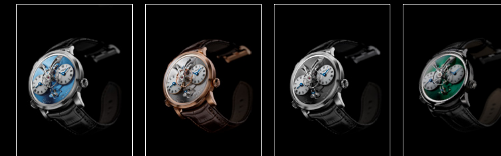
LEGACY MACHINE N°1 PLATINUM