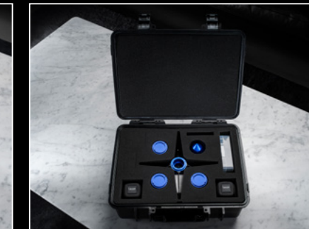
PROJECT LpX OPEN BOX