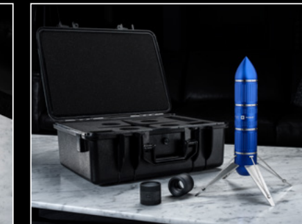
PROJECT LpX IN-SITU 1