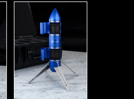
PROJECT LpX IN-SITU 2