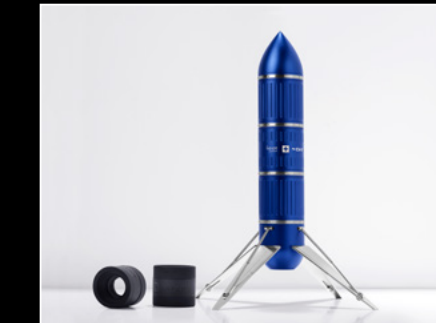
PROJECT LpX BLUE