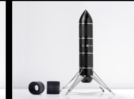
PROJECT LpX BLACK