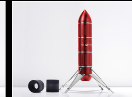
PROJECT LpX RED