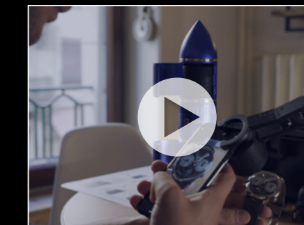
PROJECT LpX UNBOXING