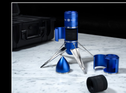
PROJECT LpX IN-SITU 3