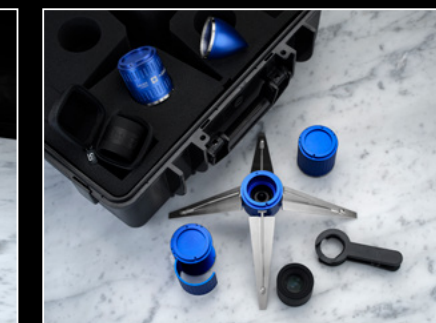
PROJECT LpX DISSASSEMBLED