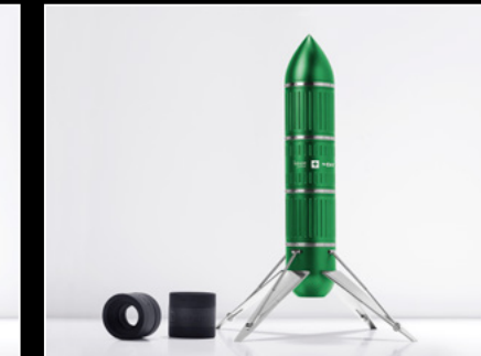
PROJECT LpX GREEN