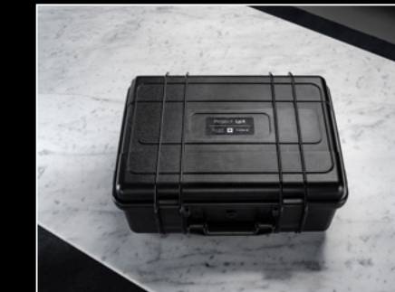
PROJECT LpX CLOSED BOX