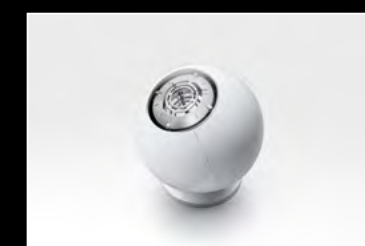
ORB WHITE CLOSED