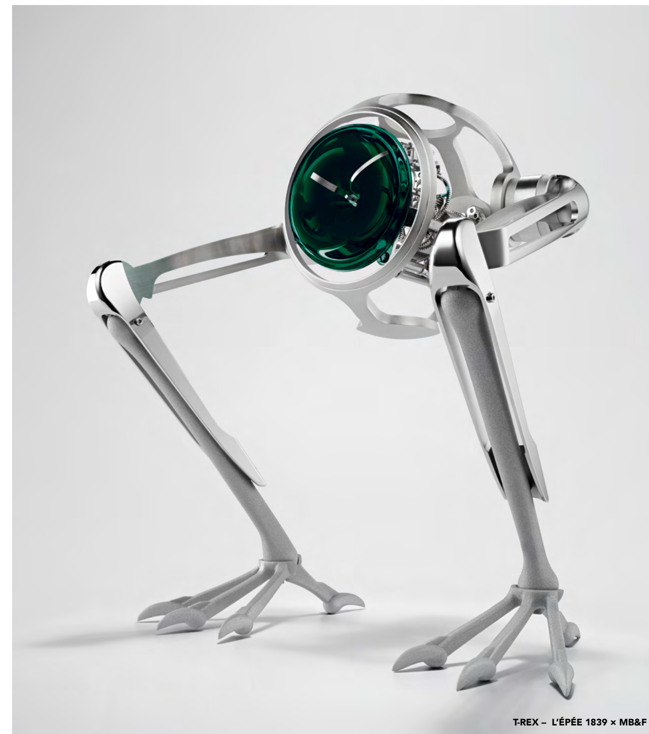
T-REX - L'ÉPÉE 1839 x MB&F