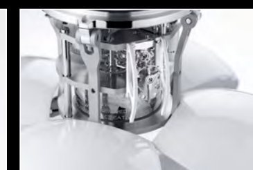
ORB WHITE CLOSE-UP