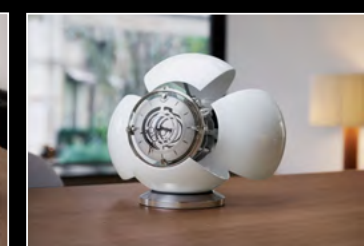
ORB WHITE LIFESTYLE