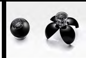
ORB BLACK DUO