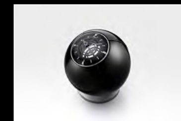
ORB BLACK CLOSED