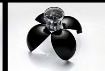
ORB BLACK OPENED