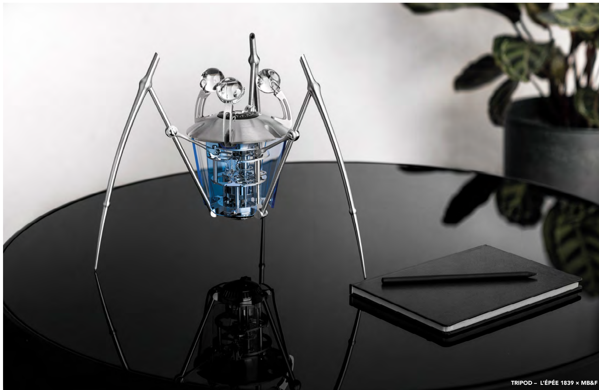
TRIPOD - L'ÉPÉE 1839 x MB&F