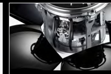
ORB BLACK CLOSE-UP