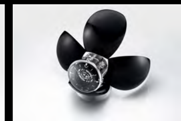
ORB BLACK SEMI-OPENED