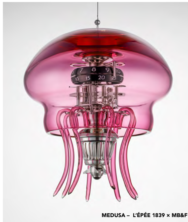
MEDUSA - L'ÉPÉE 1839 x MB&F