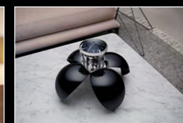
ORB BLACK LIFESTYLE