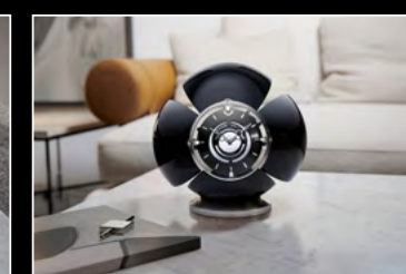
ORB BLACK LIFESTYLE