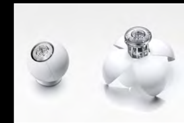
ORB WHITE DUO