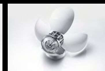
ORB WHITE SEMI-OPENED