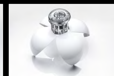
ORB WHITE OPENED