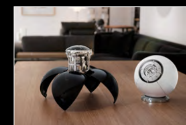
ORB DUO LIFESTYLE