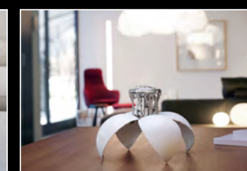
ORB BLACK LIFESTYLE