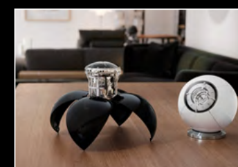
ORB DUO LIFESTYLE