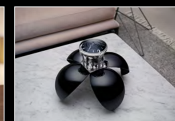
ORB BLACK LIFESTYLE