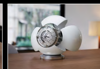
ORB WHITE LIFESTYLE