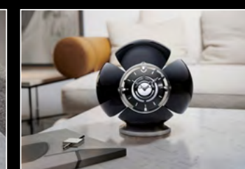
ORB BLACK LIFESTYLE