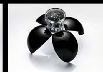
ORB BLACK OPENED