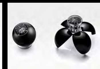
ORB BLACK DUO