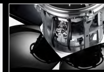
ORB BLACK CLOSE-UP