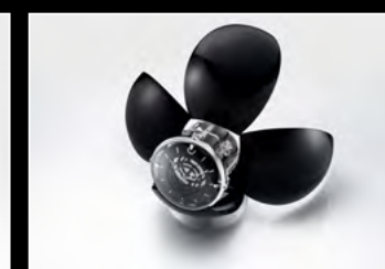
ORB BLACK SEMI-OPENED