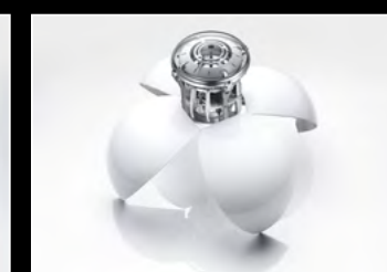
ORB WHITE OPENED