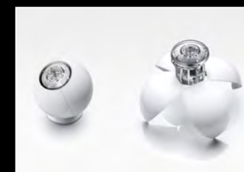
ORB WHITE DUO