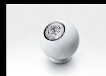
ORB WHITE CLOSED