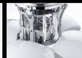
ORB WHITE CLOSE-UP