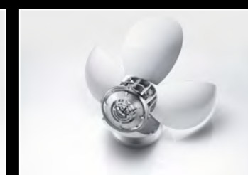
ORB WHITE SEMI-OPENED